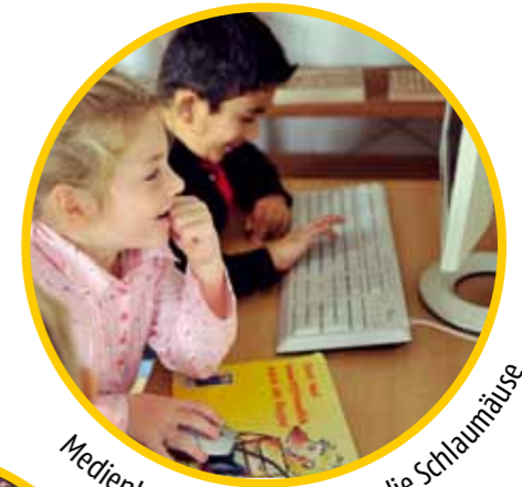
Medienkompetenz schaffen – die Schlaumäuse.