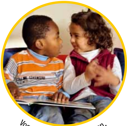
Von- und miteinander lernen.

Die AWO-Kitas nutzen die vorhandene Vielfalt der Kinder und ihrer Kulturen für die Lern – und Bildungsprozesse. Dabei steht das Kind mit seinem Recht auf individuelle Förderung im Mittelpunkt. Wir schaffen in unseren Kitas die Voraussetzungen dafür, dass jedes Kind an der Gemeinschaft teilhaben kann. Die Kita-Erzieher/innen stärken die Kinder in ihren Identitäten, ermöglichen ihnen Erfahrungen mit Unterschieden und regen zum kritischen Denken über Einseitigkeiten und Ungerechtigkeiten an.