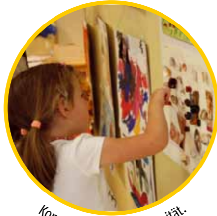
Konzentration und Kreativität.