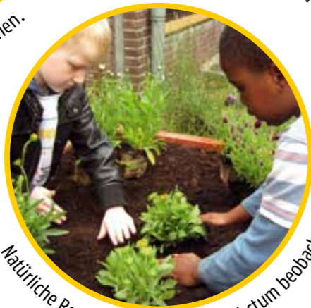
Natürliche Ressourcen pflegen – Wachstum beobachten.