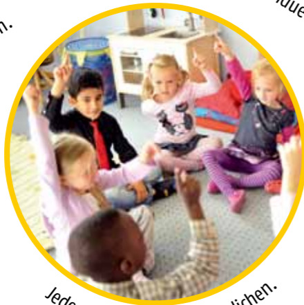
Jedem Kind Teilhabe ermöglichen.