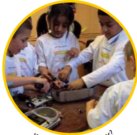
Wie funktioniert hier was?