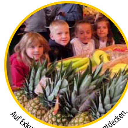
Auf Exkursionen die Umgebung entdecken.