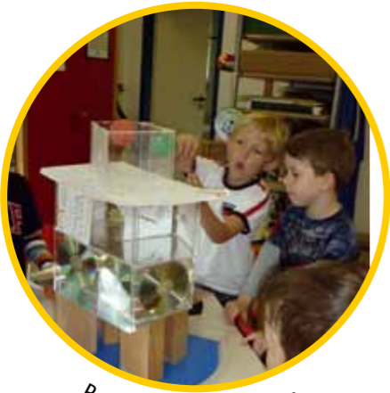
Bauen und Konstruieren.

Durch bildnerisches Gestalten, Konstruieren, Anfertigen von Collagen und anschließendem Präsentieren erhalten Kinder die Gelegenheit, ihre bunte innere Welt darzustellen. Sie erleben, wie durch ihre Kreativität etwas Neues entsteht und sind stolz auf ihre Fähigkeiten.