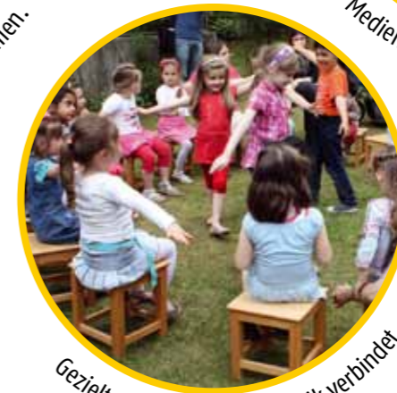
Gezielte Bewegungen zu Musik verbindet.