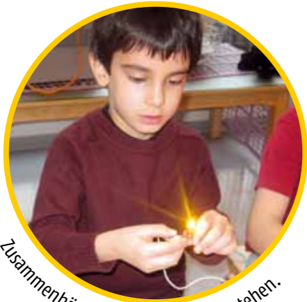
Zusammenhänge erforschen und verstehen.

Wie funktioniert eine Glühbirne? Was brauchen Pflanzen zum Leben? Und wie sieht ein Radio von innen aus? Unsere Kitas greifen die naturwissenschaftliche Neugier der Kinder auf und vermitteln erste physikalische, chemische, biologische und technische Erkenntnisse.