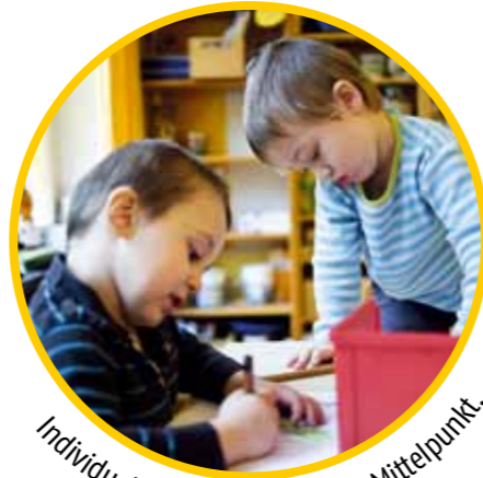
Individuelle Förderung steht im Mittelpunkt.