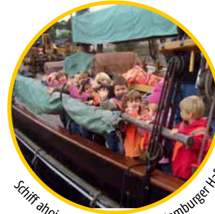
Schiff ahoi – Kennenlernen des Hamburger Hafens.

Ausflüge bereichern die Erfahrungswelt der Kinder, ob in die Umgebung, auf den Markt oder zur Verkehrserziehung. In der Kita begegnen sich verschiedene Kulturen. Kinder erfahren beispielsweise, was andere Kulturen essen, wie sie leben und welche Sitten und Bräuche es gibt. Sie feiern miteinander verschiedene Feste und Rituale und lernen so, tolerant miteinander umzugehen.