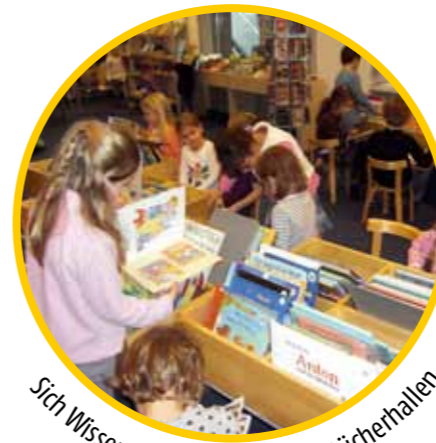
Sich Wissen aneignen – in den Bücherhallen.

Unsere Kita-Erzieher/innen schaffen gezielt Situationen, in denen Kinder etwas erzählen oder beschreiben können und ermuntern sie, hierfür treffende Worte und Sätze zu verwenden. Im Jahr vor der Schule lernen die Kinder erste Buchstaben und Worte kennen und den eigenen Namen zu schreiben. Wir besuchen mit ihnen die Bücherhalle und führen sie in die Welt des Computers ein. Die Intelligenz Ihres Kindes wird auch durch bewusstes Musikhören, -machen sowie Bewegungen zu Musik unterstützt.