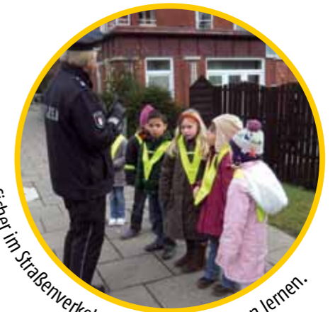
Sicher im Straßenverkehr – Regeln akzeptieren lernen.