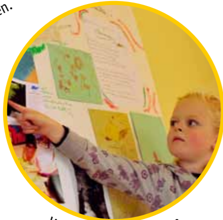
Vor einer Gruppe sprechen.