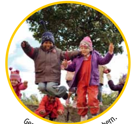
Gemeinsam Naturräume erobern.