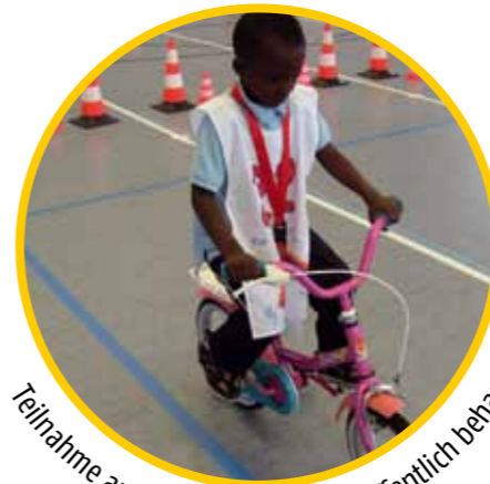
Teilnahme an Wettbewerben, sich öffentlich behaupten.